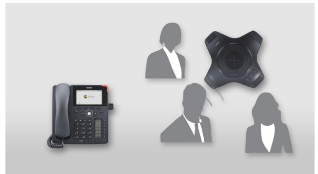
Jetzt können Sie den angeschlossenen kabellosen Lautsprecher in bis zu 25 m Entfernung verwenden.