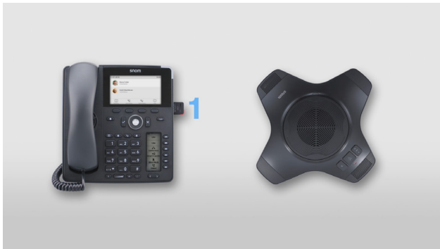
Dongle in das Gerät einstecken