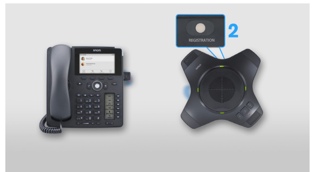
Herstellen einer DECT-Verbindung zum drahtlosen Lautsprecher